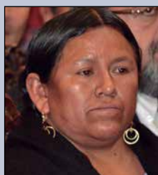
Nemesia Achacollo Tola MINISTRA DE DESARROLLO RURAL Y TIERRAS