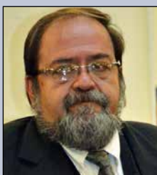
Roberto Iván Aguilar Gómez MINISTRO DE EDUCACIÓN