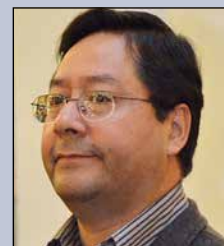
Luis Alberto Arce Catacora MINISTRO DE ECONOMÍA Y FINANZAS PÚBLICAS