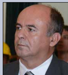
Reymi Luis Ferreira Justiniano MINISTRO DE DEFENSA