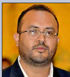
Milton Claros Hinojosa MINISTRO DE OBRAS PÚBLICAS, SERVICIOS Y VIVIENDA