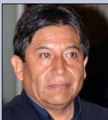
David Choquehuanca Céspedes MINISTRO DE RELACIONES EXTERIORES