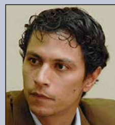
Marko Marcelo Machicao Bankovic MINISTRO DE CULTURAS Y TURISMO