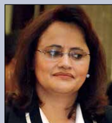
Lenny Tatiana Valdivia Bautista MINISTRA DE TRANSPARENCIA INSTITUCIONAL Y LUCHA CONTRA LA CORRUPCIÓN