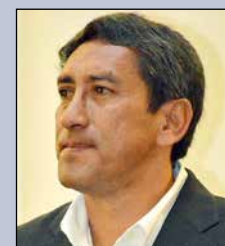
Tito Rolando Montaña Rivera MINISTRO DE DEPORTES