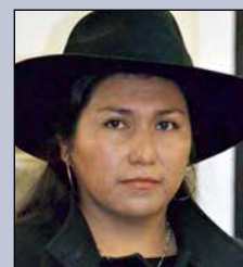
Marianela Paco Durán MINISTRA DE COMUNICACIÓN