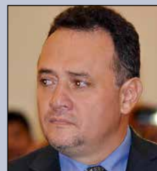
René Gonzalo Orellana Halkyer MINISTRO DE PLANIFICACIÓN DEL DESARROLLO