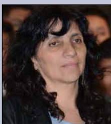
Ana Verónica Ramos Morales MINISTRA DE DESARROLLO PRODUCTIVO Y ECONOMÍA PLURAL