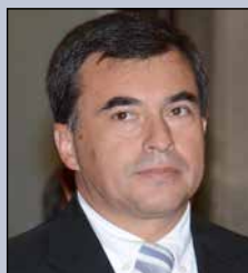
Juan Ramón Quintana Taborga MINISTRO DE LA PRESIDENCIA