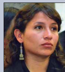
Ariana Campero Nava MINISTRA DE SALUD