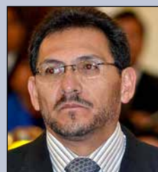
José Gonzalo Trigo Agudo MINISTRO DE TRABAJO, EMPLEO Y PREVISIÓN SOCIAL